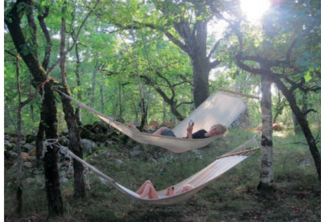
← Camping De Bois-Redon

Zo gezellig bij de tent lijkt het dampende asfalt al snel ver weg